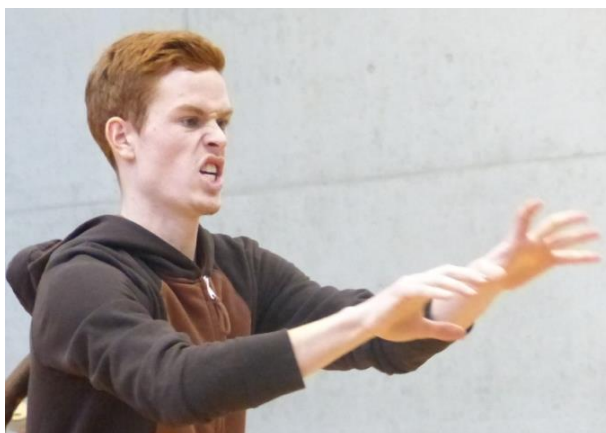
Tanzschritt "Der Tiger"