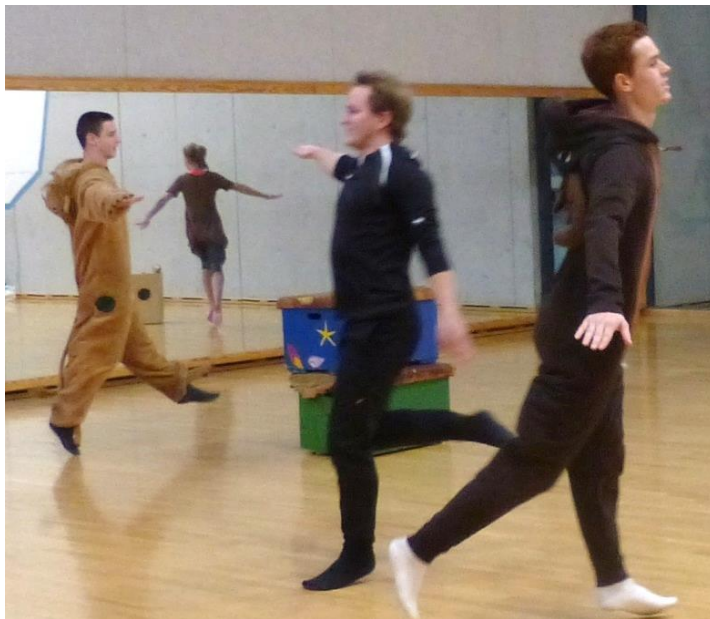
Die Tänzer "fliegen" durch den Raum und landen im Dschungel

Das Dschungelthema wird durch die Tanzschritte unterstützt, welche unterschiedliche Tiere interpretieren. Zusätzlich fördern Kostüme die thematische Darstellung sowie die Choreographie.