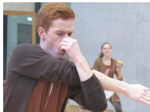
Tanzschritt "Der Elefant"